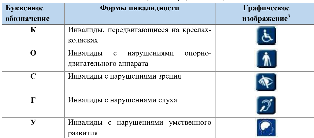
Классификация форм инвалидности

В зависимости от формы инвалидности лицо сталкивается с определенными барьерами, мешающими ему пользоваться зданиями, сооружениями и предоставляемыми населению услугами наравне с остальными людьми.