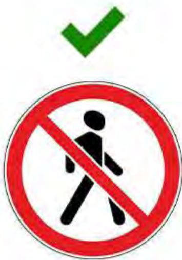
Движение пешехода запрещено